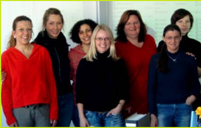
Immer für Sie da - unser Operator-Team

Unser Operator-Team ist im letzten Jahr von drei auf sieben Mitarbeiter angewachsen, darunter eine Auszubildende.